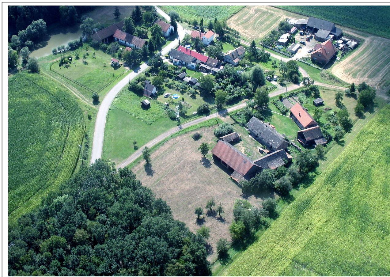
Kouty od východu